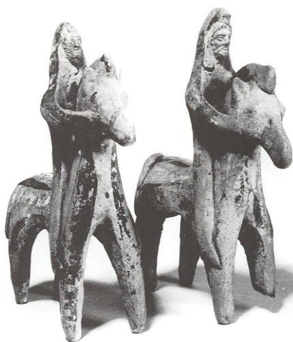
۱۰) دو سوار پارسی، گل، از آرامگاه شماره ۱۶ در تسامبرس، قبرس، احتمالاً قرن سوم پ.م، موزه اشمولین آکسفورد (Moorey, 2000: 486, pl. IV).