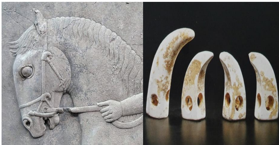
۸) نقش برجسته سر اسب با بست‌های روی افسار، کاخ هدیش، تخت جمشید، قرن چهارم پ.م (تالیس ۱۳۹۲: ۴۳۷، تصویر ۵۸).