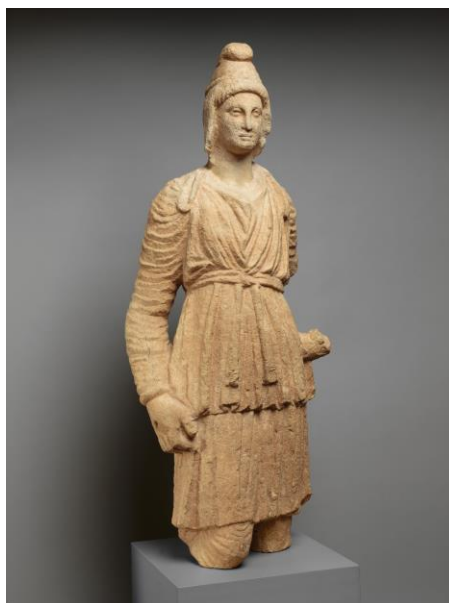
۵) پیکره از سنگ آهک، نیایشگاه آپولو در کوریون، قبرس، قرن سوم پ.م. مجموعه چزنولا، موزه هنر متروپولیتن، نیویورک.