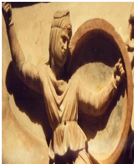
۴) نقش برجسته یک شکارچی پارسی با سرپوش، تابوت موسوم به تابوت اسکندر، صیدا، پایان قرن چهارم پ.م. موزه باستان‌شناسی استانبول.