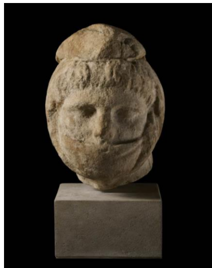
۳) سر یک پارسی با سرپوش، سنگ مرمر، موزلیوم هالیکارناسوس، حدود ۳۵۰ پ.م. موزه بریتانیا، لندن.