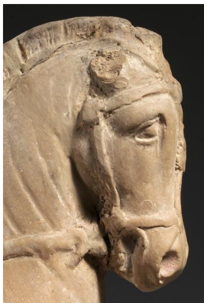
۶) جزئیات سر اسب با افسار تزئین شده با دندان، پیکرک سوارکار، گل، احتمالاً کیتیون، قبرس، پایان قرن چهارم و قرن سوم پ.م. مجموعه چزنولا، موزه متروپولیتن، نیویورک.