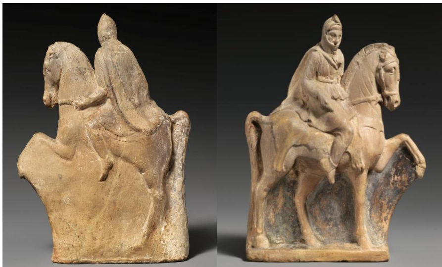
(۱) پیکرک سوارکار با پوشش پارسی، گل، احتمالاً کیتیون، قبرس، پایان قرن چهارم و قرن سوم پ.م. مجموعه چزنولا، موزه متروپولیتن، نیویورک. (۲) پشت پیکرک سوارکار با پوشش پارسی، گل، احتمالاً کیتیون، قبرس، پایان قرن چهارم و قرن سوم پ.م. مجموعه چزنولا، موزه متروپولیتن، نیویورک.